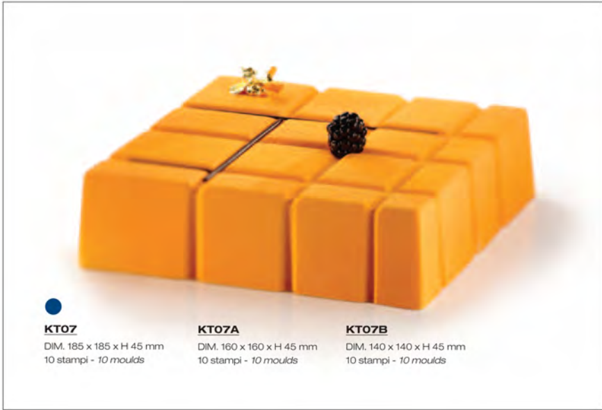
● KT0Z DIM. 185 x 185 x H 45 mm 10 stampi - 10 moulds