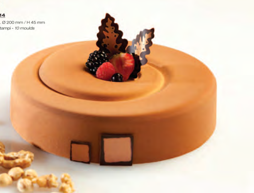
● KT14 DIM. Ø 200 mm / H 45 mm 10 stampi - 10 moulds