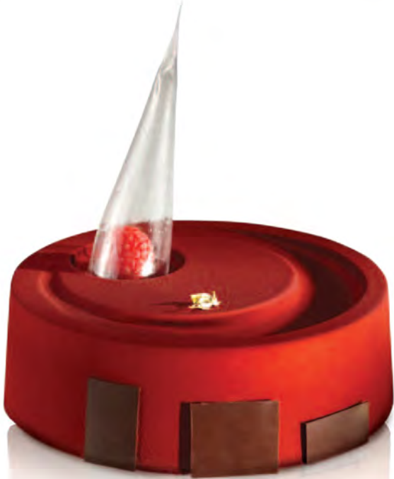
● KT01 DIM. Ø 200 mm / H 45 mm 10 stampi - 10 moulds