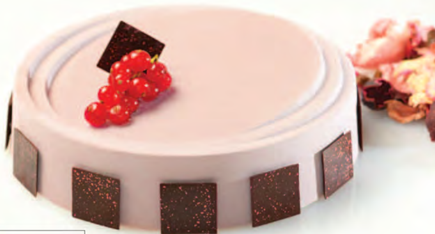
● KT15 DIM. Ø 200 mm / H 45 mm 10 stampi - 10 moulds