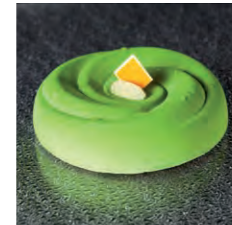
INSERT DISKS PAVOFLEX PX061

To complete the Pavocake system, Pavoni presents PX061, a silicone mould 600x400 mm (23.62x15.74 in.) with 6 indents to create insert cake disks.