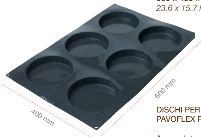
DISCHI PER INSERIMENTO PAVOFLEX PX061

A completamento del sistema Pavocake, Pavoni presenta PX061, uno stampo in silicone, dimensione 600x400 mm, avente 6 impronte per la creazione di dischi da inserimento.